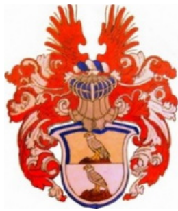
WAPPEN DER FAMILIE MOLT